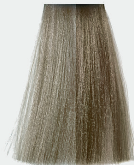
9.0 very light natural blonde