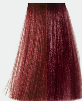
7.66 intense red blonde