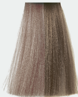
9.2 very light lavender blonde