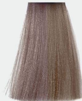
9.32 very light golden pearl blonde