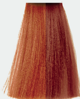
8.44 light blonde copper