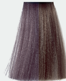
8.21 light blonde ash violet