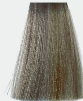
7.71 cold blonde ash