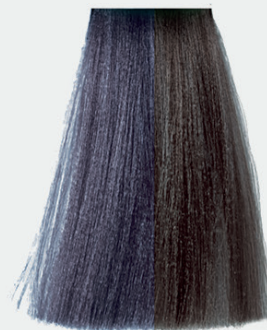
8.22 light blonde violet